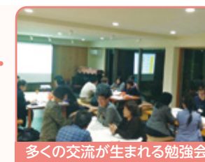
多くの交流が生まれる勉強会

患者さん・ご家族が安心して最期まで地域で過ごせる為の仲間づくり・地域づくりを推進していきます。専門職スタッフによる緩和ケア・地域多職種連携による在宅医療の実践・啓蒙活動(定期勉強会開催)などを行います。