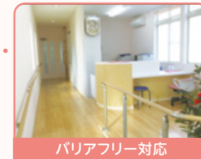
バリアフリー対応

かかりつけ医は、心身に不安を感じている方の力になります。 一人ひとりの人生により添い、不安を安心に変える医療の架け橋になります。 専門医療機関と連携を図り、外来通院から訪問診療とトータルサポートを行います。