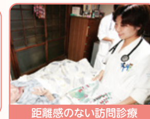
距離感のない訪問診療