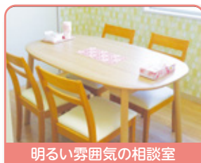
明るい雰囲気の良い相談室